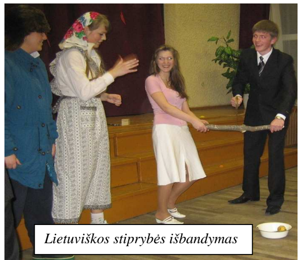
Lietuviškos stiprybės išbandymas