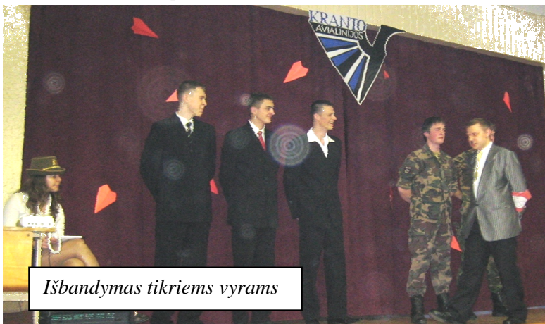
Išbandymas tikriems vyrams