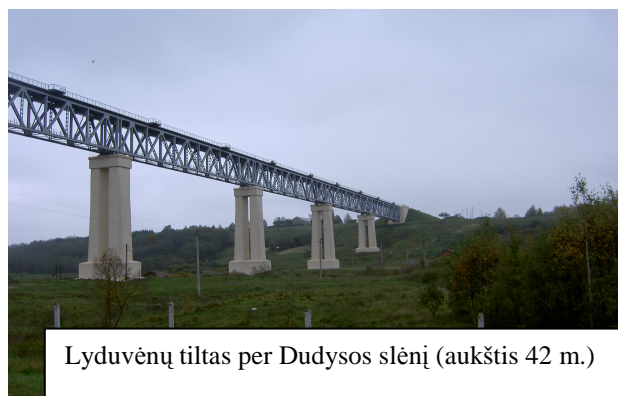
Lyduvėnų tiltas per Dudysos slėnį (aukštis 42 m.)