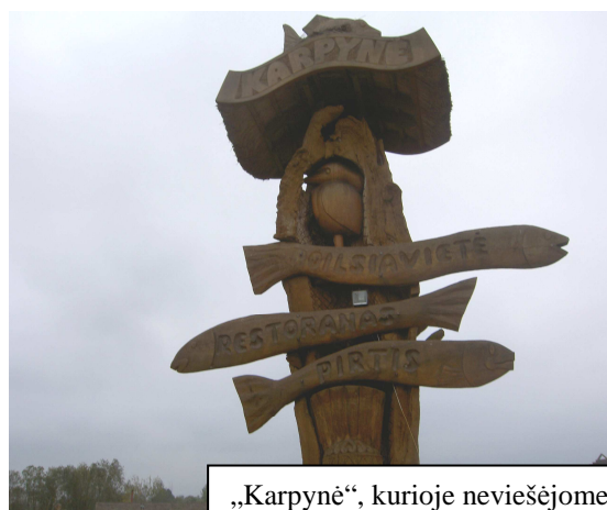
„Karpynė“, kurioje neviešėjome.