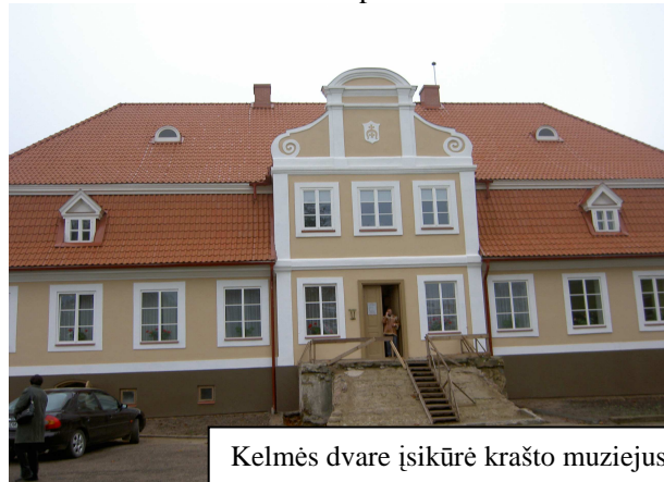
Kelmės dvare išsikūrė krašto muziejus.