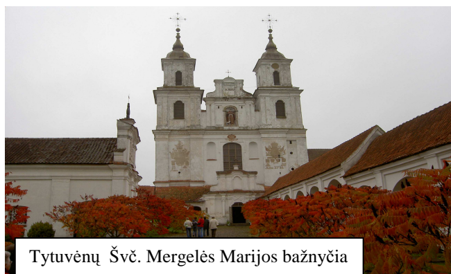
Tytuvėnų Švč. Mergelės Marijos bažnyčia