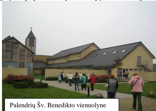
Palendrių Šv. Benedikto vienuolyne

Spalį mokytojai keliavo po Žemaitiją. Maršruto idėja – Ž. Aleknieienės.