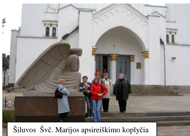
Šiluvos Švč. Marijos apsiėiškimo koplyčia