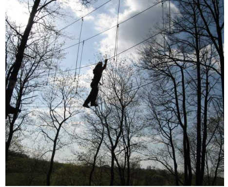
E. Eitkevičiūtė, 7a kl.